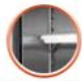
Grilles sur taquets (4 taquets par grille)