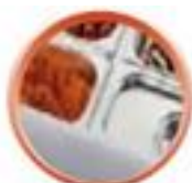
Plan de travail polypropylène