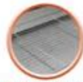
Kit de récupération à fromage