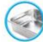
Bacs GN inclus