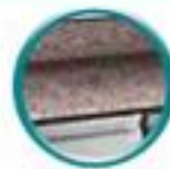
plan de travail granit