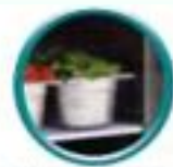
Grilles sur glissières