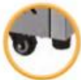
Grilles sur glissières