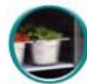
Grilles sur glissières