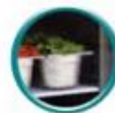
Grilles sur glissières