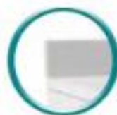
Dossier H 100 mm