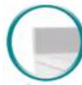
Dossieret H 100 mm