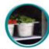
Grilles sur glissières