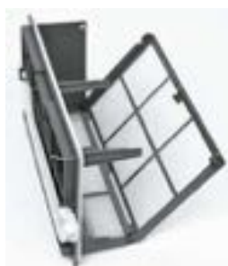
Filtre spécial condenseur