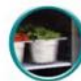
Grilles sur glissières