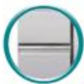
Tiroirs en option